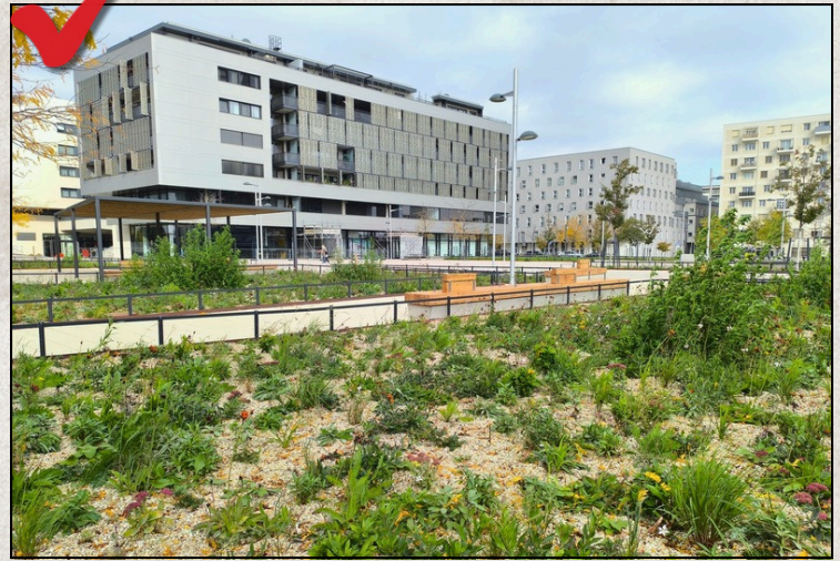
Der neue Maria-Trapp-Platz bietet Platz für Entspannung aber auch Feste wie den Kirtag.